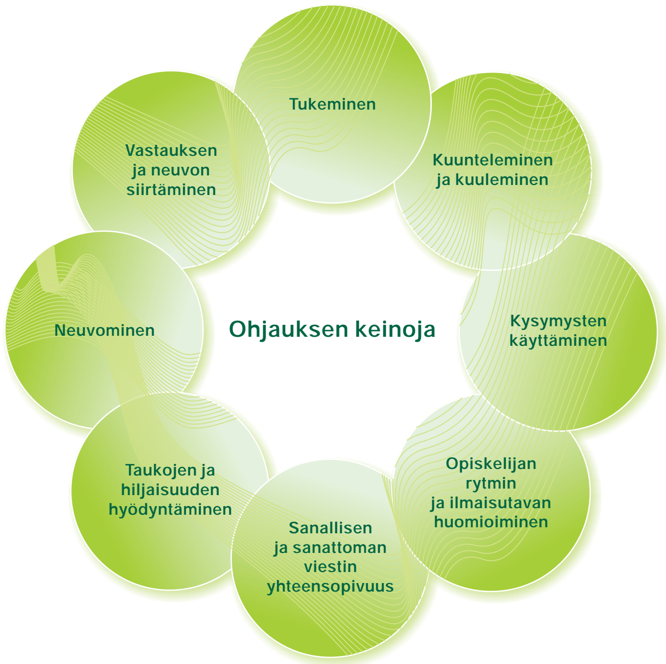
Kuvio 3. Ohjauksen keinoja Mukaillen Mykrää (2007).

Työpaikkaohjaaja voi käyttää erilaisia keinoja opiskelijan oppimisen edistämisen tueksi. Ohjauksen keinot ovat yleisiä vuorovaikutukseen liittyviä asioita ja sopivat erilaisiin ohjaustilanteisiin ja ohjauskeskusteluihin. Ohjauksen keinoja esitellään seuraavassa kuviossa.